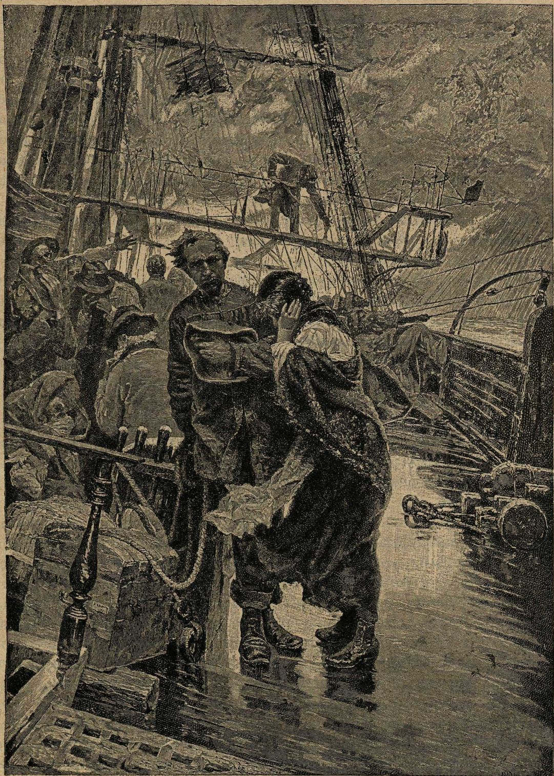
На пароходѣ во время крушенія.