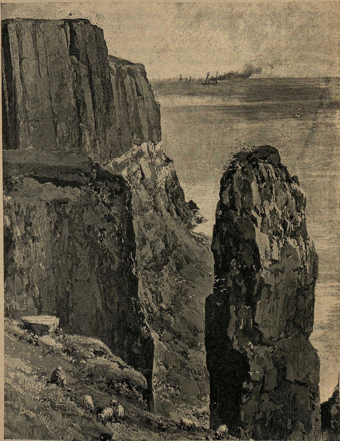
У Крымскихъ береговъ.